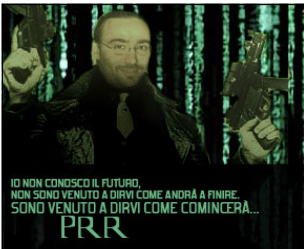
Campagna elettorale pagata con gli AdSense di Veronablog.com

Anche se i soliti maligni sostengono che la sua sia solo una mossa ad effetto per chiedere poi a Tengi di divenire first lady della pearà, il Nostro s'è già armato di tutto ciò che un candidato sindaco deve avere: un sorriso a trentadue denti, un pacchetto di cicche e un partito col nome ad effetto. A tal proposito, grande spargimento di carte in seno al centrosinistra dopo l'annuncio che don Domizià correrà con un suo partito il cui stile si rifarà al radical-chic di ispirazione butelistica spritzosa con echi di sinistra british. A tal proposito sono già stato contattati i butèi Senziosi per un brainstorming che dovrebbe stilare (nel senso di dare stile) il programma secondo i punti che il gggiovane veronese medio potrebbe fare propri.